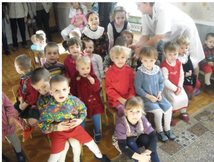
Een aantal van de kindertjes uit het TBC-internaat

Het bedrag dat wij willen bijeenbrengen om de ergste nood te bestrijden is € 4500,00. Elke eurocent wordt goed besteed!