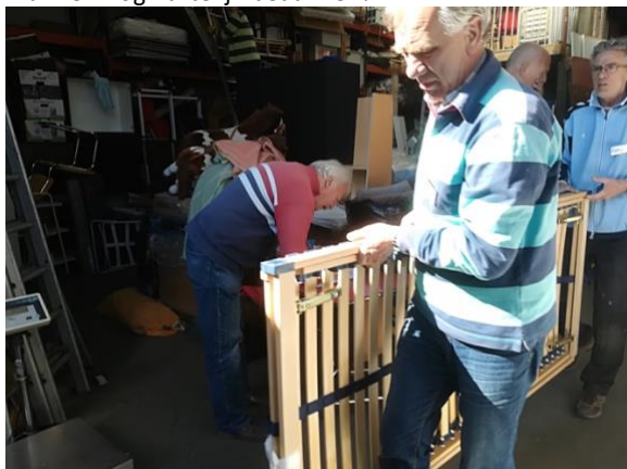
De mannen van de Rotary Radboud helpen in onze opslag helponshelpenhelponshelpenhelponshelpenhelponshelpenhelpons

Ook zijn we een maandag aangenaam verrast door de komst van een aantal leden van de Rotary "Radboud" uit Medemblik die ons een morgen hebben geholpen bij onze werkzaamheden in het kader van NL Doet. Een heel geslaagd initiatief. Het was leuk en wij willen de mannen nog hartelijk bedanken!