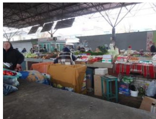
markt in Mogoliv-Podolskyi