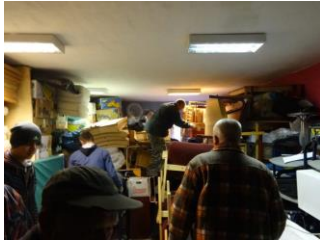
Opslag van de goederen