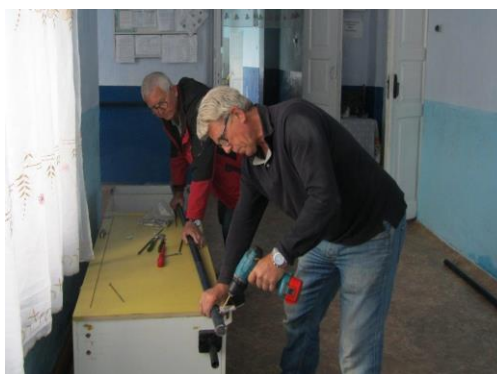
links de noeste werkers voor de nieuwe keuken en rechts de montage van een leuning

De reis is verder vlot verlopen zonder ernstig oponthoud en ook de terugreis ging prima zodat we eigenlijk nog een dag eerder terug waren dan aanvankelijk gedacht.