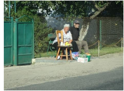
Aanbod eigen producten onderweg