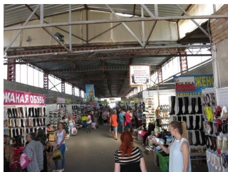
Een miniem stukje van deze immense markt

strategische plekken in de steden reizigers oppikken en tegen een relatief laag tarief vervoeren naar andere steden. In Xmelnitskyi is een gigantische grotendeels overdekte markt waarbij de complete Beverwijkse zwarte markt in het niet valt, het is gewoon een dorp op zich. Heel bijzonder om dat eens mee te maken!