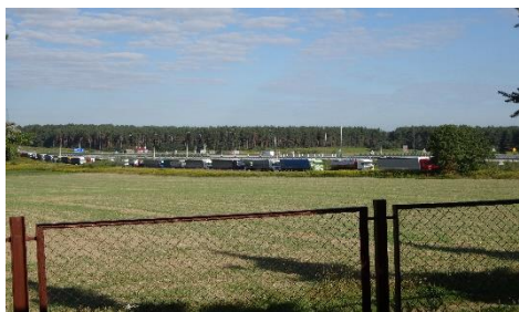
Rij wachtende vrachtauto's bij de Poolse grens

Zo komen we automatisch bij het tweede transport naar Oekraïne dit jaar van 23-30 augustus dat