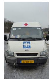
het rode kruis

Het tweede transport vond plaats vanaf 5 december en werd uitgevoerd door Jan en Jetze met alleen de Ford transit en aanhanger. Dit transport was aanvankelijk eigenlijk twee weken eerder gepland maar doordat pater Consaroek geen opslagfaciliteiten had werd het in eerste instantie afgeblazen en zijn we alsnog vertrokken toen pastoor Vasyl een stuk van zijn opslagcapaciteit beschikbaar stelde voor dit transport. Ook werd door de autoriteiten beloofd dat als het totaalgewicht onder de 3000 kilo zou blijven de goederen binnen drie weken zouden worden vrijgegeven waardoor de winterkleding nog deze winter gebruikt zou kunnen worden!! De wagen en aanhanger waren ditmaal uitgerust met een rood kruis met daarin de tekst Ukraine-Holland en caritas-spes want we hadden tijdens een eerdere grenspassage van een vrachtautochauffeur uit Oekraïne werkzaam voor een hulporganisatie, geleerd dat gemakkelijk voorrang en doorgang werd verleend als de wagen(s) uitgerust waren met een rood kruis. We hebben gelijk ook al ons officiële briefpapier aangepast en ook hierin het rode kruis verwerkt. Het bleek vooral bij de grenspassages dit transport daadwerkelijk het gewenste "rode-zee-effect" te hebben grensobstakels werden opzijgeschoven om maar ruim baan te geven aan het humanitaire transport!! Ook werd deze