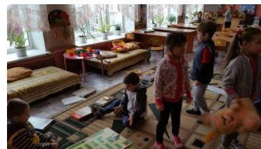
klasje met gehandicapte kinderen

helponshelpenhelponshelpenhelponshelpenhelponshelpenhelponshelpenhelponshelpenhelponshelpenhelponshelpenhelp