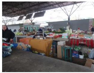
markt in Mogoliv-Podolskyi