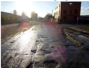
Wegdek in Oekraïne