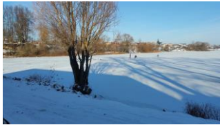
ijsvissers onderweg naar Lonky

rit duidelijk dat we wat betreft de weers- en wegomstandigheden de grens hadden bereikt van wat nog verstandig opereren was. Opgevroren sneeuw, gladde wegen, kou en een enkele keer de hulp van derden om ons weer vlot te trekken maakten dat duidelijk. De andere kant van dezelfde medaille was het sprookjesachtige landschap waardoor we reden en de goede en hoopgevende contacten die ons deze reis ten deel vielen en ons bijzonder tevreden stemden. Zo zijn we behalve bij ons oorspronkelijke reisdoel het bejaardenhuis in Lonky, waar we een aantal zelfgebreide lappendekens hebben gebracht ook in een weeshuis bij Chemerivitsche en een school met kinderen met een geestelijke en/of lichamelijke handicap geweest. Verder hebben we een aantal bezoeken afgelegd bij instanties waar we eerder al hulpgoederen hadden gebracht een internaat, ziekenhuis een school een medisch college en