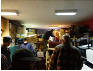
Opslag van de goederen