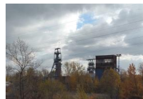
mijnbouw(resten) bij Katowice

29e oktober en 's avonds zaten we rond een uur of acht in ons "vaste" restaurant/café in Zgorzelec. De dag erop zijn we dwars door Polen gereden en hebben de horde van de grenscontroles Polen/EU-uit en Oekraïne-in nog diezelfde avond genomen zodat we al in Oekraïne konden overnachten daardoor