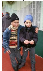
(weeshuis-) vrienden voor het leven