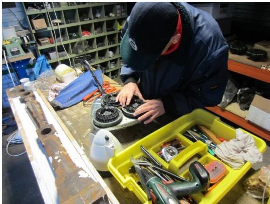
Doet ie 't of doet ie 't niet Meine?

na het verschijnen van onze laatste Nieuwsbrief: