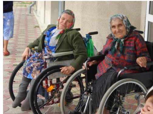
Deze bejaarden v.h. tehuis dat we bezochten hebben 't relatief goed

Er bestaat in landen als Oekraïne, Roemenië en Moldavië totaal geen sociaal vangnet zodat mensen die hulpbehoevend zijn en geen familie hebben die voor ze kan zorgen vaak letterlijk wegwijnen. Juist daarom is het hard nodig dat wij