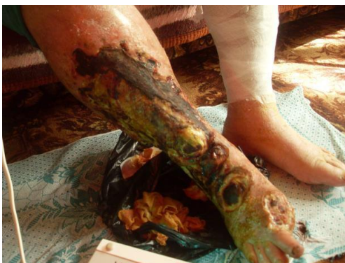
Verwaarlozing met als gevolg gangreen leidt vaak tot amputatie

internaat voor misbruikte kinderen. Zodoende hebben we toch een goede indruk gekregen hoe het er daar toegaat. Uiteindelijk zijn alle vier de chauffeurs nog behoorlijk ziek geworden waarschijnlijk na het eten van bedorven voedsel zodat we ook weer blij waren toen we thuis waren. Toch was het een mooie ervaring en was deze reis zeer waardevol ook omdat we zowel in Roemenië als in Moldavië werden geconfronteerd met de enorme nood en armoede.