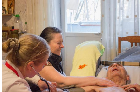
Nogmaals wijkverpleging op z'n Moldavisch

Ons transport naar Moldavië was een zeer leerzame onderneming en ging aanvankelijk met zoveel pech en problemen gepaard dat we de indruk kregen dat het niet mocht slagen. Toch hebben we uiteindelijk veel goederen gebracht en waren de mensen er geweldig blij mee en dankbaar voor. En omdat we het daarvoor doen moet de conclusie wel zijn dat ook dit transport meer dan geslaagd was!! Het was de eerste keer dat we dit land als eindbestemming hadden en alles was daarom nieuw en veel dingen lagen weer net even anders dan in Oekraïne. De reis was langer en moeilijker dan verwacht en voerde ondermeer door Hongarije en Roemenie. Op de grens tussen Hongarije en Roemenie was