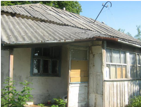
In dit soort huisjes doen de wijkverpleegsters hun werk!

internaat voor misbruikte kinderen. Zodoende hebben we toch een goede indruk gekregen hoe het er daar toegaat. Uiteindelijk zijn alle vier de chauffeurs nog behoorlijk ziek geworden waarschijnlijk na het eten van bedorven voedsel zodat we ook weer blij waren toen we thuis waren. Toch was het een mooie ervaring en was deze reis zeer waardevol ook omdat we zowel in Roemenië als in Moldavië werden geconfronteerd met de enorme nood en armoede.