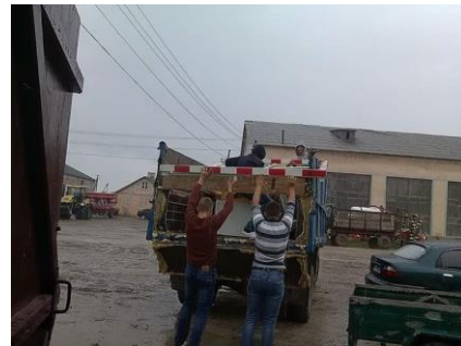
Voetbaldoeltjes voor het internaat

helponshelponshelpenhelpenhelpenhelpenhelpen