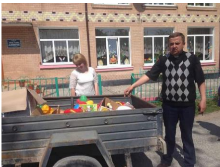
Plastic speelgoed voor een schooltje