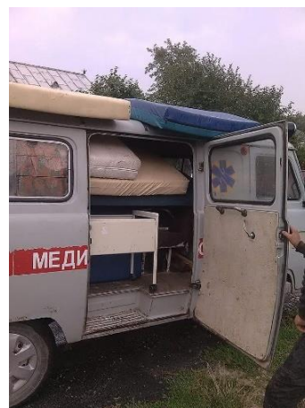
Een busje vol ook het dak wordt gebruikt!

Heel anders dan bij ons waar we met dichte bestelbussen of vrachtauto's rijden moet in Oekraïne de pastor alle materialen verdelen met de daar voor handen vervoersmiddelen: een open aanhanger, een oude vrachtauto of de ambulance wordt ingezet om alle materialen te verdelen. De spullen gaan naar scholen, een internaat, een ziekenhuis en het medisch college. Uit het bejaarden tehuis in Lonky halen ze de goederen zelf op, bijgaand een foto-impressie.