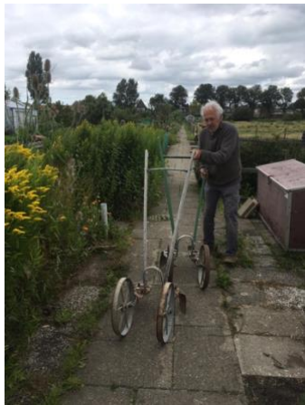
Wij kunnen voor het project gereedschappen leveren om de grond te bewerken en zaden voor gewassen.

Daarom was de gedachte het moet op-, of in elk geval voor het platteland zijn want daar is de nood het hoogst. Tijdens onze transporten door het Oekraïense landschap was ons keer op keer opgevallen dat er grote lappen grond ongebruikt braak lagen. Tijdens een van die tochten richting Chemerivitche werden we zelfs een keer overvallen door een stofstorm. Dat is wat erosie doet met lang braakliggend terrein en dat terwijl Oekraïne toch ooit bekend was als de graanschuur van Europa en Rusland!!