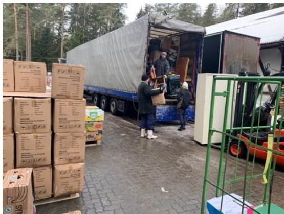
En vervolgens gelost in Mogilev in Wit-Rusland.....