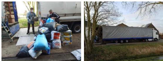
Hier wordt in Hensbroek alweer de 3e trailer dit jaar geladen!

De eerste Nieuwsbrief van dit jaar. Laten we hopen dat er straks ook weer eigen vervoer van- en naar de landen waar we de hulp brengen mogelijk is, zoals we gewend waren. Sinds vorig jaar zijn we begonnen met het inhuren van professionele Oekraïense en Wit-Russische vervoerders die dan volgeladen trailers hulpgoederen naar hun land brengen als retourvracht. Dat werkt prima maar kost de stichting natuurlijk behoorlijk wat meer dan wanneer we de transporten zelf verzorgen! We kunnen op deze manier ook niet zelf vaststellen of de spullen komen waar we ze hebben willen. We vragen onze contacten daar om verslag te doen middels foto's die ons worden geleverd door de hulporganisaties die de goederen daar naar de bestemming brengen, telefoon- en mailverkeer en houden op die manier een oogje in het zeil. Groot voordeel is dat op deze manier ongelooflijke hoeveelheden kunnen vervoerd en zo de opslag ook wat minder overvol raakt!!