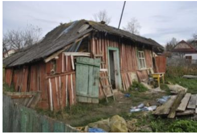
Een dak boven het hoofd maar hoe hou ik 't droog en warm?!

Daarom was de gedachte het moet op-, of in elk geval voor het platteland zijn want daar is de nood het hoogst. Tijdens onze transporten door het Oekraïense landschap was ons keer op keer opgevallen dat er grote lappen grond ongebruikt braak lagen. Tijdens een van die tochten richting Chemerivitche werden we zelfs een keer overvallen door een stofstorm. Dat is wat erosie doet met lang braakliggend terrein en dat terwijl Oekraïne toch ooit bekend was als de graanschuur van Europa en Rusland!!